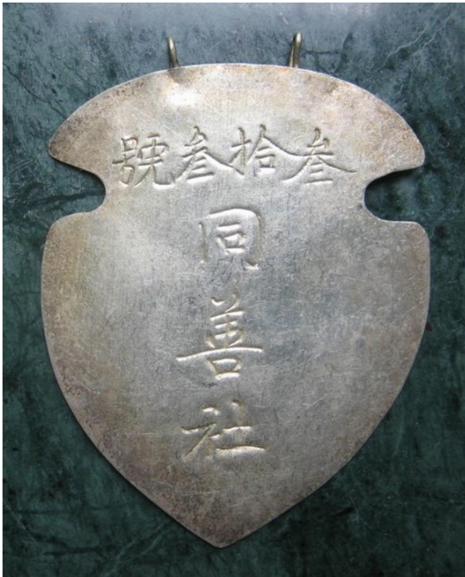
同善社早期銀製掛牌之一 ——掛牌上刻有「參拾參號 同善社」字樣。