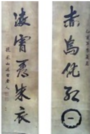
迴龍夫子墨寶之一