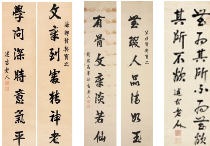
迴龍夫子墨寶三幅

如意圖，同善社道內最令人熟悉的墨寶， 全幅文字以硃砂色筆觸完成，「如」字彷彿祥龍一般，似若蟄伏，亟思躍動， 在冷峻沉厚的力勁與自在豪氣的揮灑中，飽含著無限正氣與道韻， 亦展現出迴龍夫子當年於神州救災救難救民於水火的絕對誓願與無比決心。 據教授先生云，如意圖避邪蕩穢， 而同善社早期全國各省號的先生們，若是經 迴龍夫子考驗個人內體工程後符合恩職資格， 即各給親筆如意圖一張以茲證明，作為文憑分發各省督催理體。