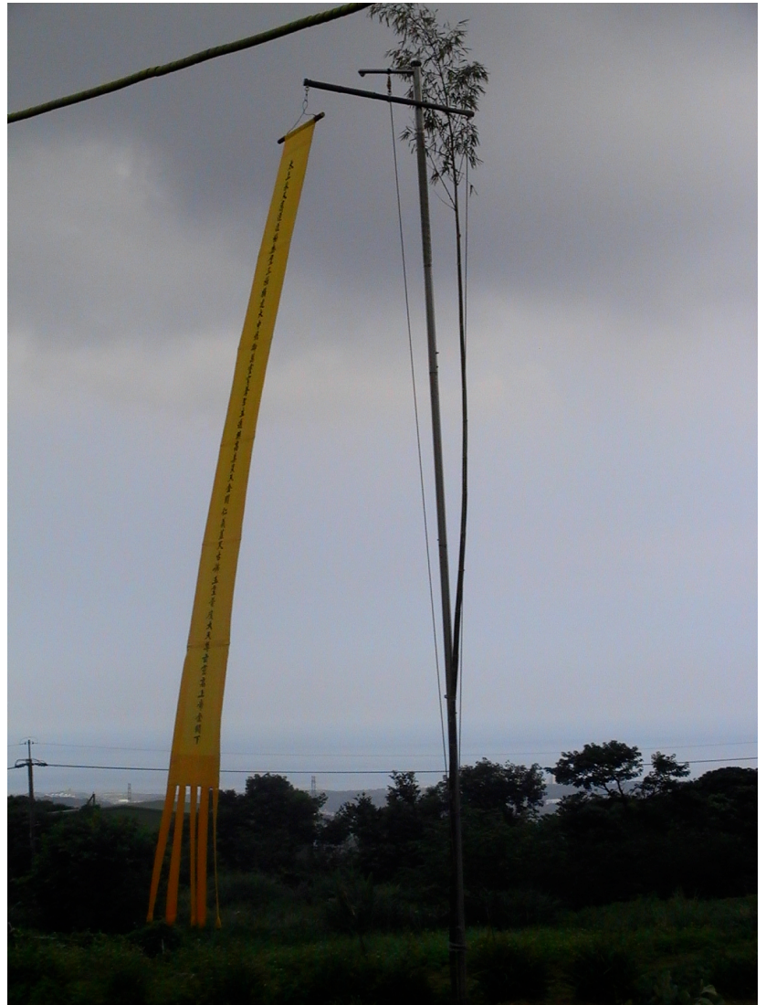
同善社利幽會上之皇籓 於新北市三芝道場