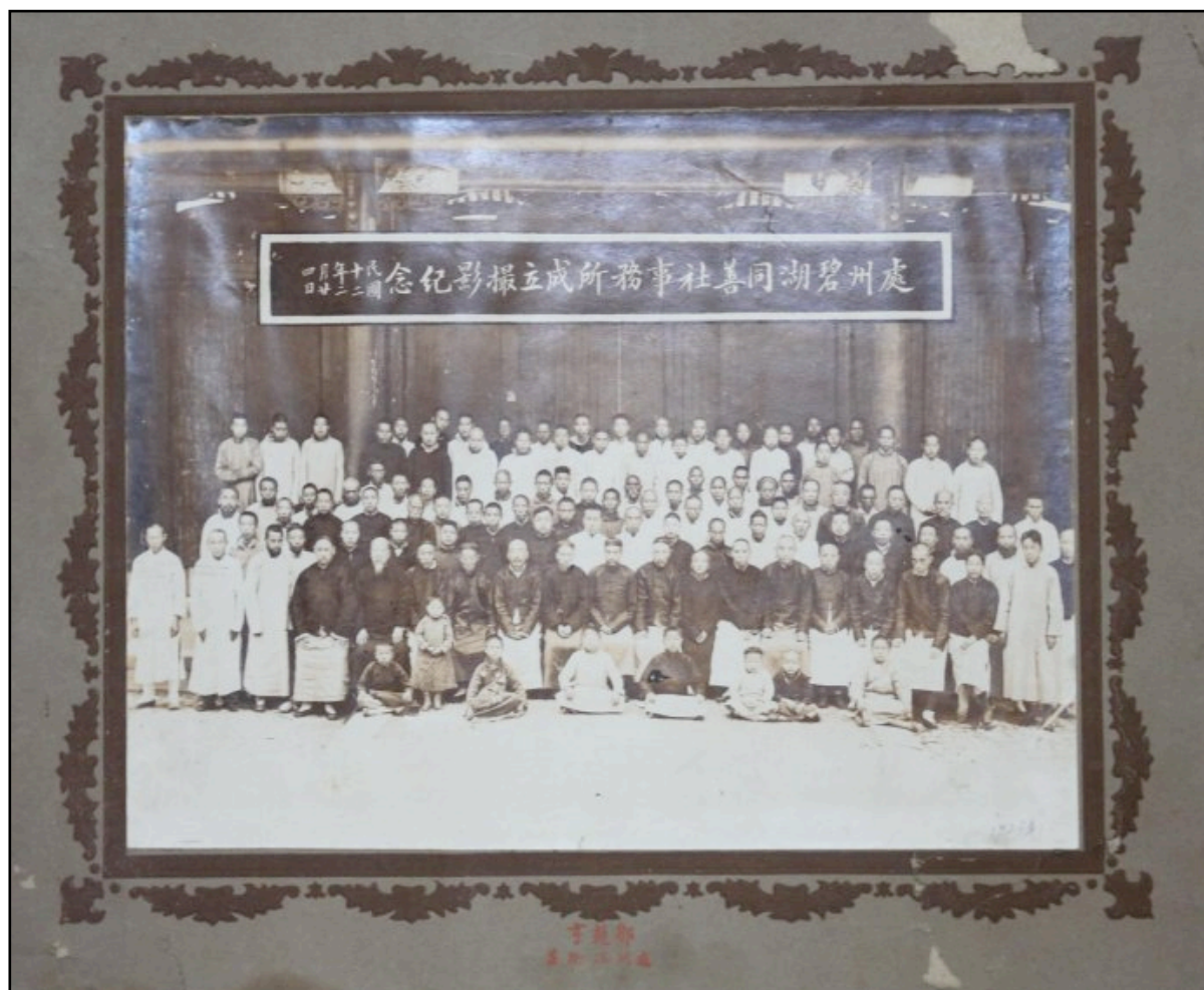
民初老照片：處州碧湖同善社

這張老照片現收藏於蓮都區檔案館，整張照片裝裱精美，照片底部和周邊補有彩色紙質底板。照片上方的題字為「處州碧湖同善社事務所成立攝影紀念，民國十二年二月廿四日」。由此可知此照片於西元1923年2月24日為紀念碧湖同善社成立而拍社攝，照片中人數眾多，共有110多人。